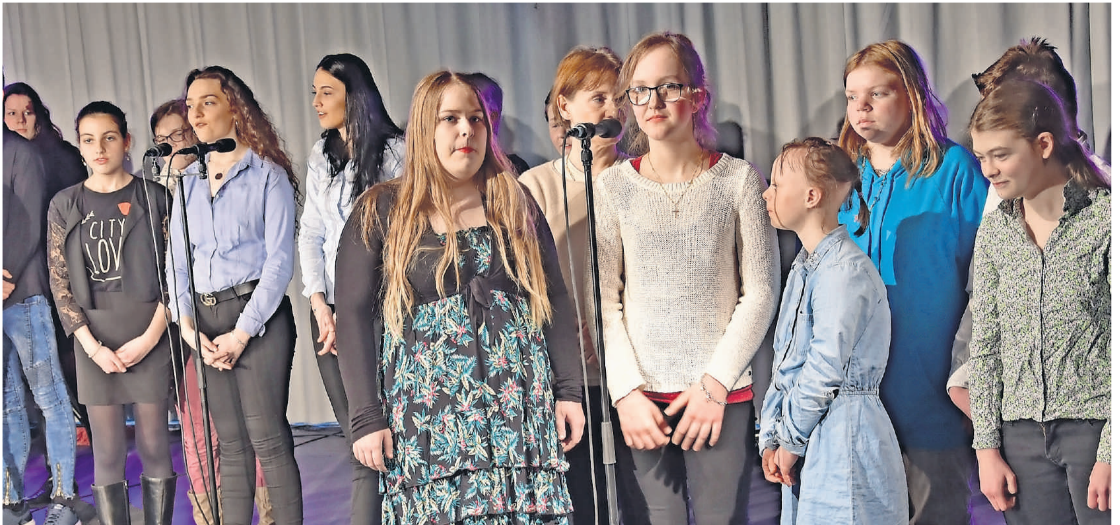
Kinder, Schülerinnen und Schüler der Heilpädagogischen Schule Zofingen musizierten und sangen an ihrer Fotoausstellung.