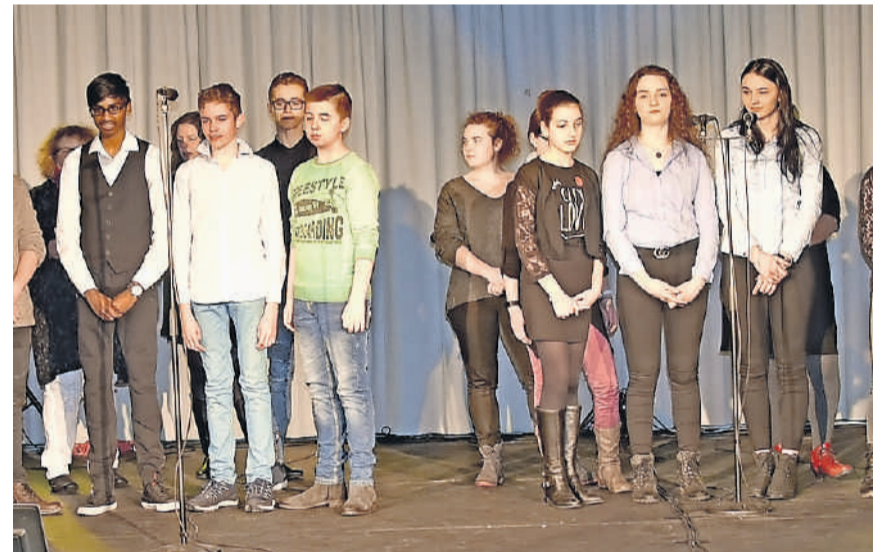
Das Fotoprojekt «Ansichtssache» der rund 100 Kinder dauerte inklusive Vorbereitungen ein Jahr.

zielen, war die Absicht des Projektes», so die Schulleiterin der Heilpädagogischen Schule Zofingen, Priska Glogner. Die Portraits aller beteiligten Kinder und Jugendlichen wurden in einem Fotobuch verewigt. Dass auch ein solches Schulprojekt nicht ohne Sponsoren auskommt, wurde an der